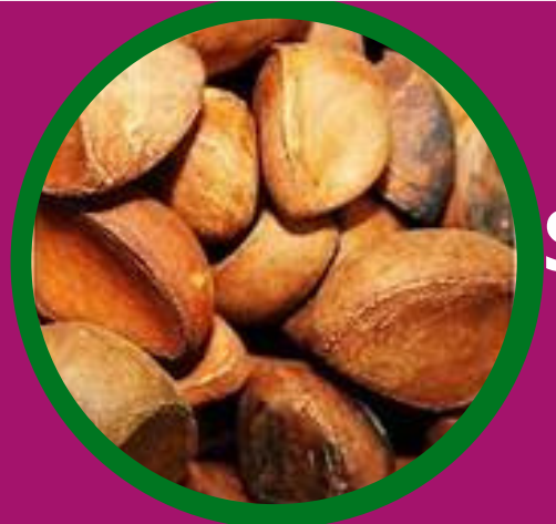
Sementes de andiroba