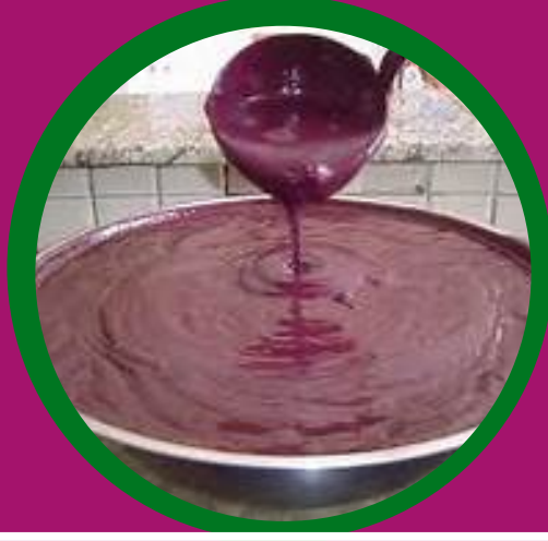
"vinho do açaí" vendido a litro