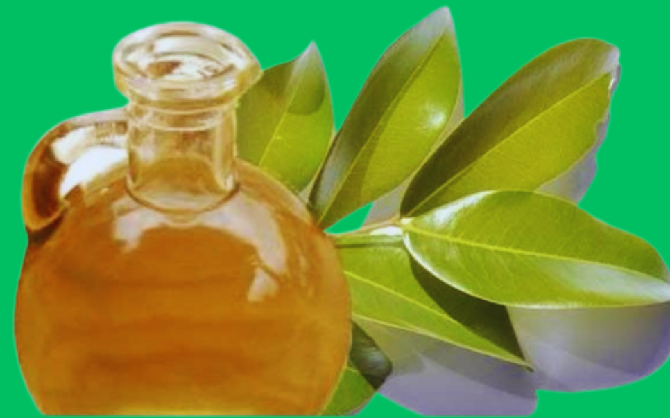
oleo de copaíba

-Uso medicinal -propriedades anti- inflamatórias, analgésicas, antisépticas, cicatrizantes e emolientes.