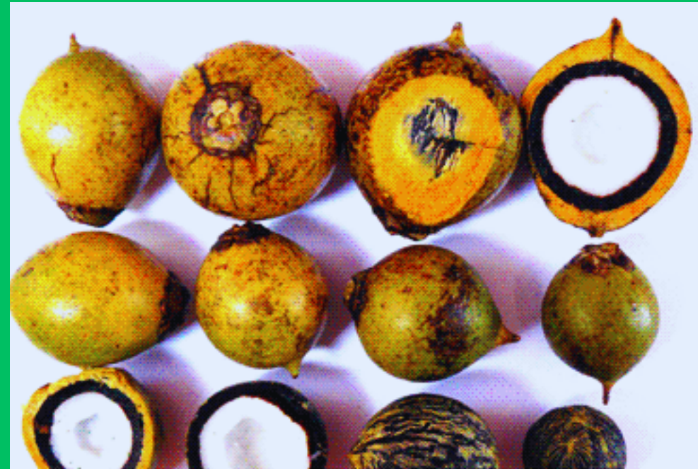
Tucumã (in natura congelado)

-Indústria de cosméticos obtém a manteiga de murumuru; -combinação de manteiga de murumuru e ucuuba propicia um tratamento excelente para peles ressecadas e cansadas; -é comercializado a amendoa seca da semente do murumuru