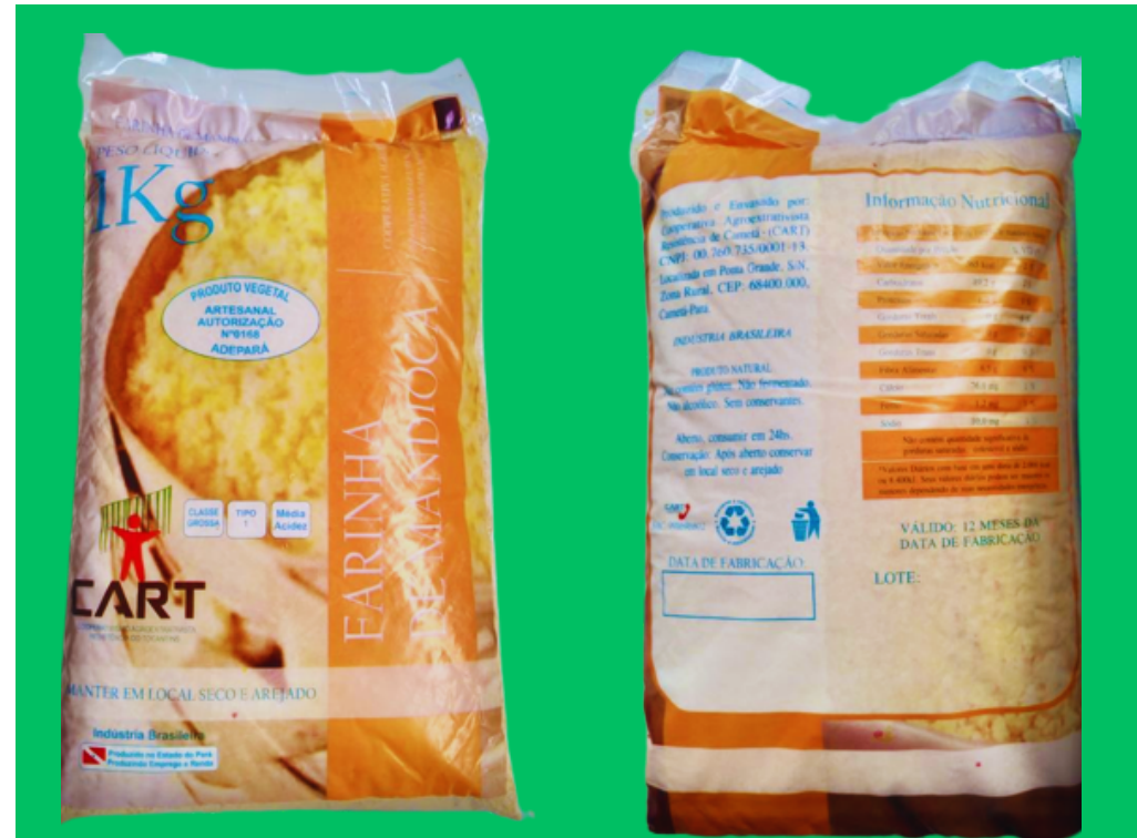
Farinha de mandioca