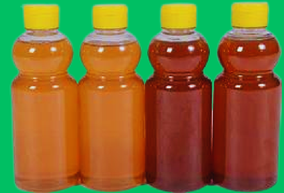
Mel de abelha

Uso medicinal -Estimula a cicatrização -Auxilia na expectoração -melhora o funcionamento dos rins etc.