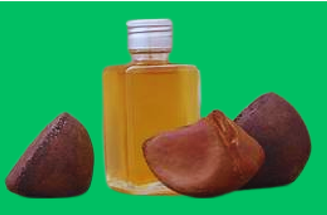
azeite de andiroba

-Uso medicinal -propriedades anti- inflamatórias, analgésicas, antisépticas, cicatrizantes e emolientes.