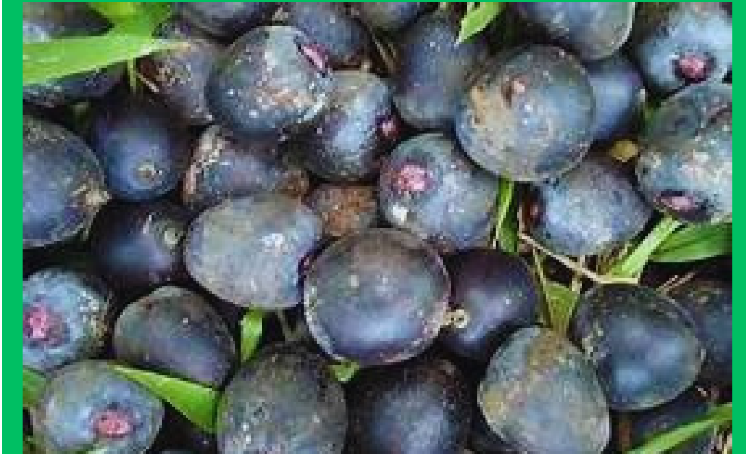
Patauá (in natura congelado)

-A indústria de cosméticos obtém o óleo e manteiga de tucumã; -polpa é altamente nutritiva, óleo que é rico em propriedades funcionais, em carotenoides, em antioxidantes, rico nas chamadas gorduras boas; -é comercializado o fruto do tucumã congelado)