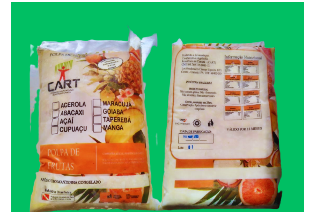
Polpas de frutas