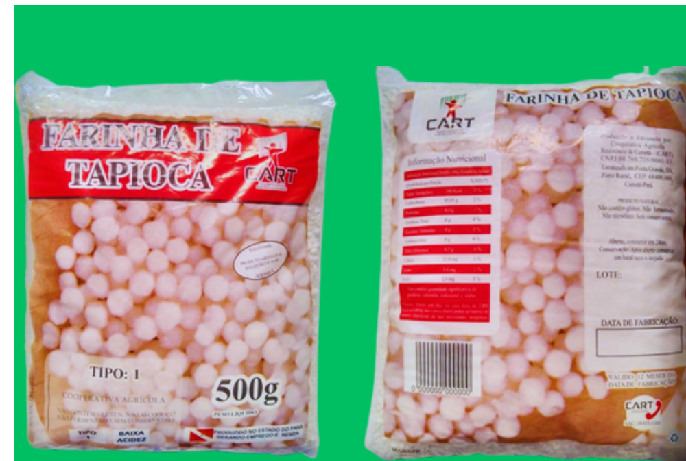
Farinha de tapioca