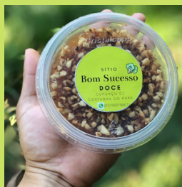
DOCE DE CUPUAÇU COM CASTANHA