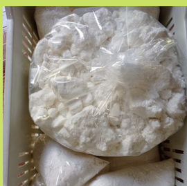
GOMA DE TAPIOCA