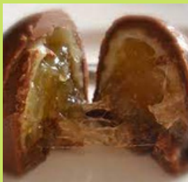
BOMBOM DE CUPUAÇU