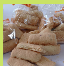
BISCOITO DE CASTANHA