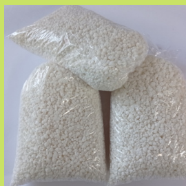
FARINHA DE TAPIÓCA SEM CASTANHA