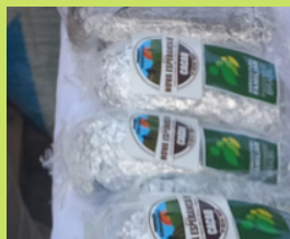
CACAU EM BARRA