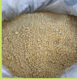
FARINHA DE MANDIOCA