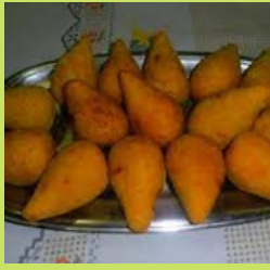
BOLINHO DE MACAXEIRA