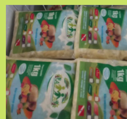
POLPA DE FRUTAS