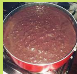
MINGAU DE ARROZ COM AÇAÍ