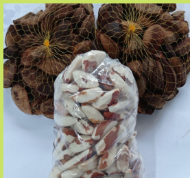
CASTANHA DO PARÁ