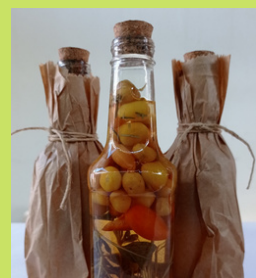
MOLHO DE PIMENTA