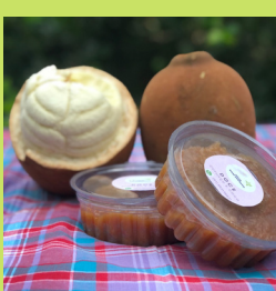
DOCE DE CUPUAÇU