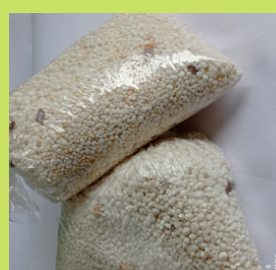
FARINHA DE TAPIÓCA COM CASTANHA