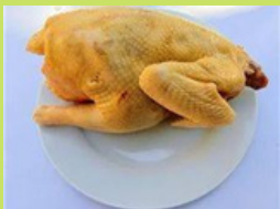
GALINHA CAIPIRA DEPENADA