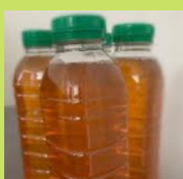
MEL DE ABELHA