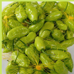
PIMENTA DE CHEIRO